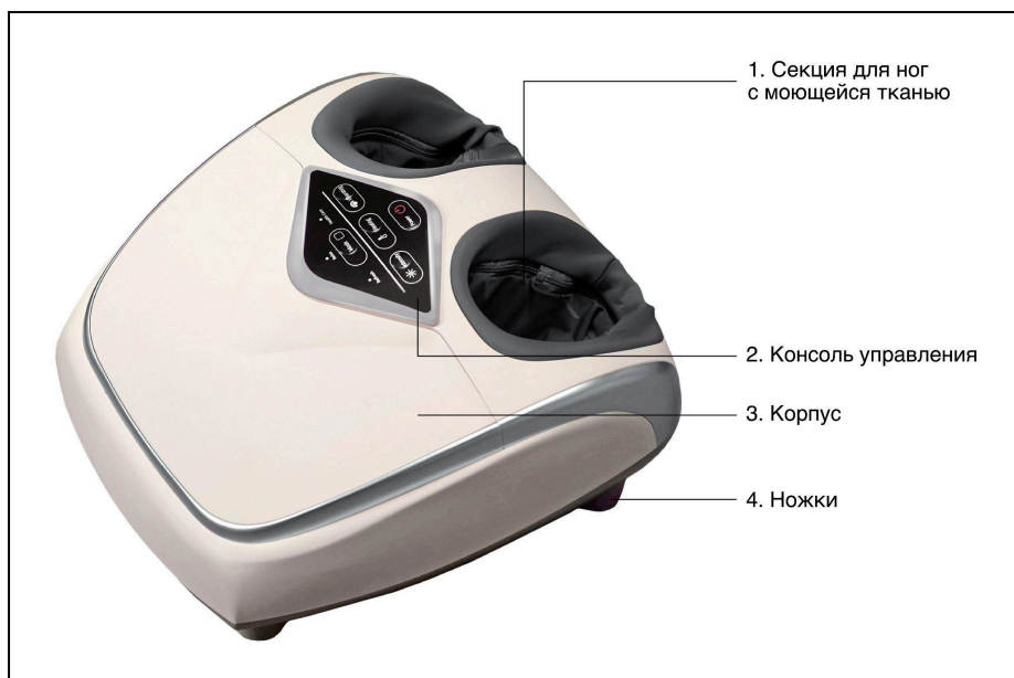
Рисунок 1 – Устройство массажера