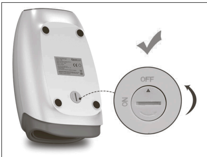
Рисунок 2 — Выпуск воздуха