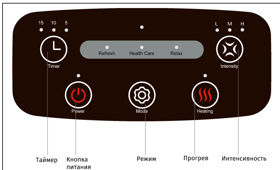
Рисунок 1 – Управление